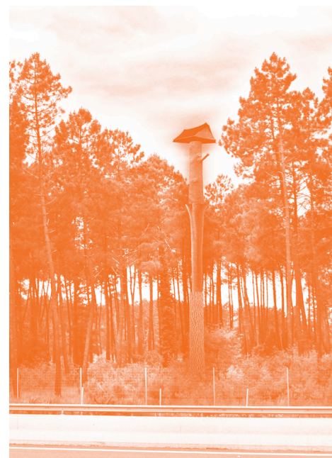
Projet de Didier Marcel pour Captieux.

Vous pourrez alors bénéficier de diverses propositions de médiation et de communication autour du projet selon vos souhaits et d'avantages fiscaux. Un don permet une diminution de l'impôt égale à 66% de son montant pour les particuliers et 60% pour les entreprises.