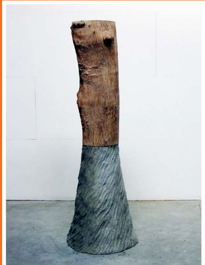
Arbre strié 2004

À travers ses sculptures Roland Cognet, cherche à transformer le geste d'appropriation artistique, sa détermination se fonde sur l'exploitation des matériaux variés, fragments de réalité riche en formes qui sont extraites de la nature.