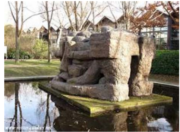
ETIENNE MARTIN 1913-1995