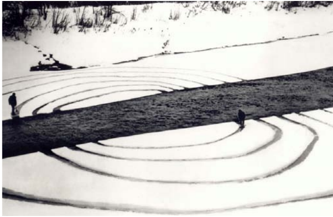
DENIS OPPENHEIM 1938-2011