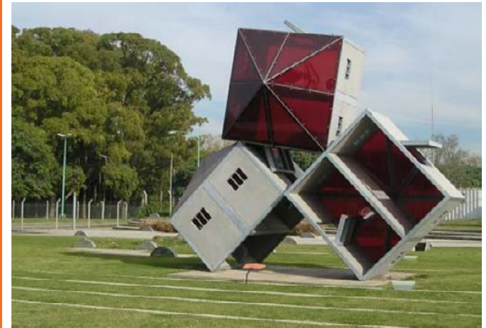
BRUCE NAUMAN 1947-