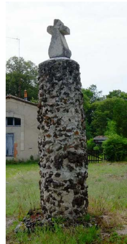
Croix et borne de sauveté de Lüe (40420)

Ref: http://www.bastides.org/nouvelle_approche.html