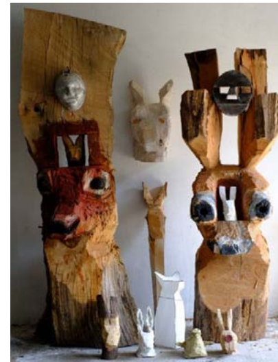
Animaux , 2012 Matériaux divers Hauteur 2m30

Il travaille sur quatre séries: les bêtes, les cabanes, les outils, et les signes.