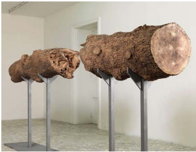
Giuseppe Penone, tra, 2008 Acier, bronze 197 x 458 x 69 cm