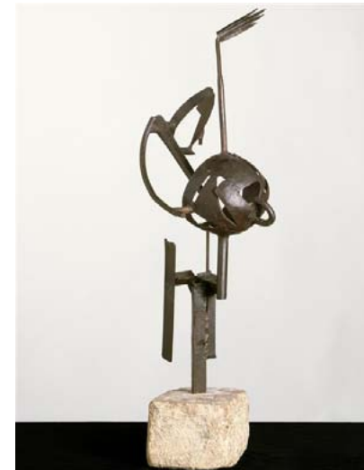
Julio Gonzalez, Le rêve - le baiser, 1934 bronze

Utilisation de matériaux naturels, relation forte à la nature, simplicité : Giuseppe Penone (Arte povera, Italie).