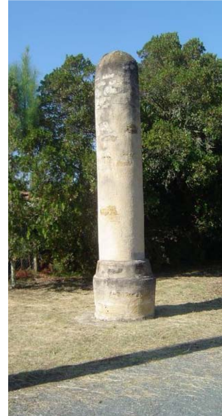
Colonne de la sauveté de Saint-Girons (40)