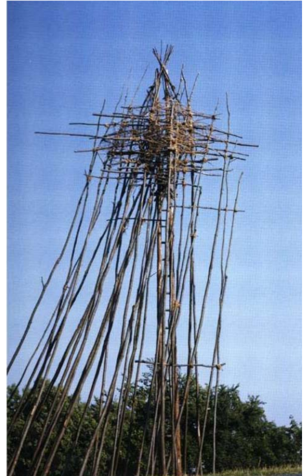
Nils Udo, la tour de la pluie, 1983 Mâts de chêne rouge, tronc d'épicéa, tiges de noisetier, lianes de clématites

La cabane/abri comme objet de travail artistique : land-art (Nils Udo), art contemporain (Etienne Boulanger)