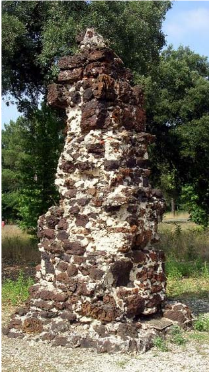
Pyramide de la sauveté de Mimizan (40)