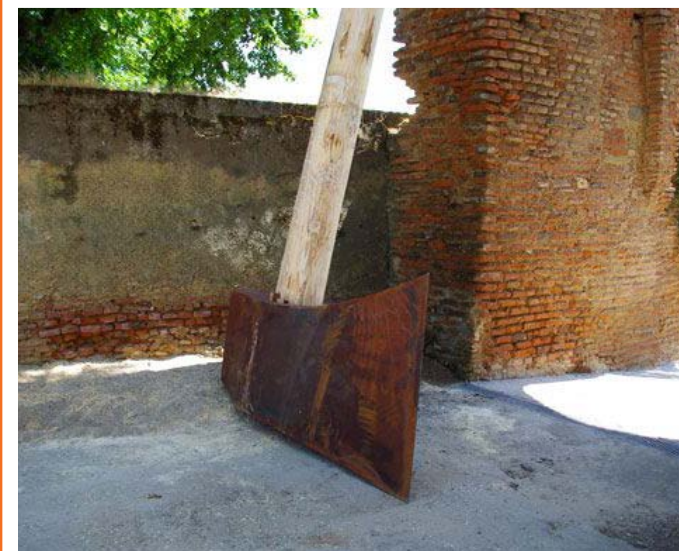
La colère des Titans , 2014 acier soudé & bois de peuplier hauteur 8 m installation au Mas-d'Agenais