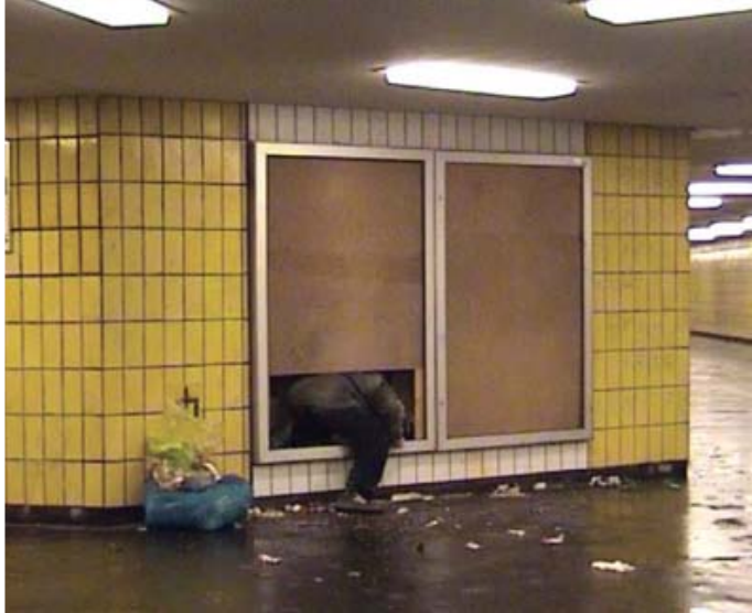
Etienne Boulanger, Plug-in shelter, Berlin, 2002 Intervention en milieu urbain

La cabane/abri comme objet de travail artistique : land-art (Nils Udo), art contemporain (Etienne Boulanger)