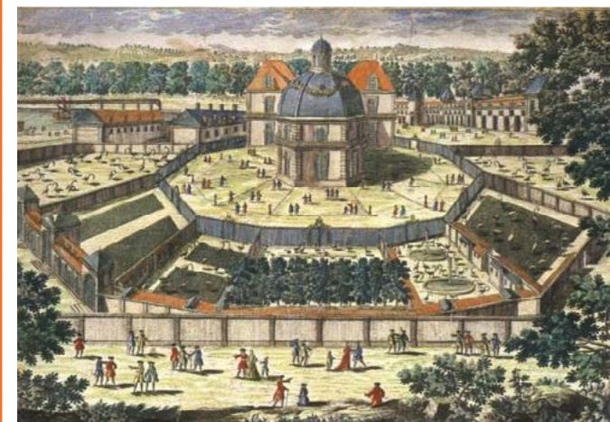
Ménagerie de Versailles, vue arrière, sous le règne de Louis XIV

Les zoos ont ensuite évolué en fonction des connaissances scientifiques vers une mission de préservation des espèces en danger et de vulgarisation auprès d'un large public. Afin de permettre la reproduction d'espèces en captivité et la réintroduction de certaines dans leurs milieux naturels, les zoos ont dû faire des efforts pour le bien-être animal : respecter leurs besoins physiologiques, leurs besoins de socialisation, d'espace et d'intimité, d'action et d'exercices. Les animaux sont ainsi encouragés à se comporter comme si ils étaient en liberté dans la nature.