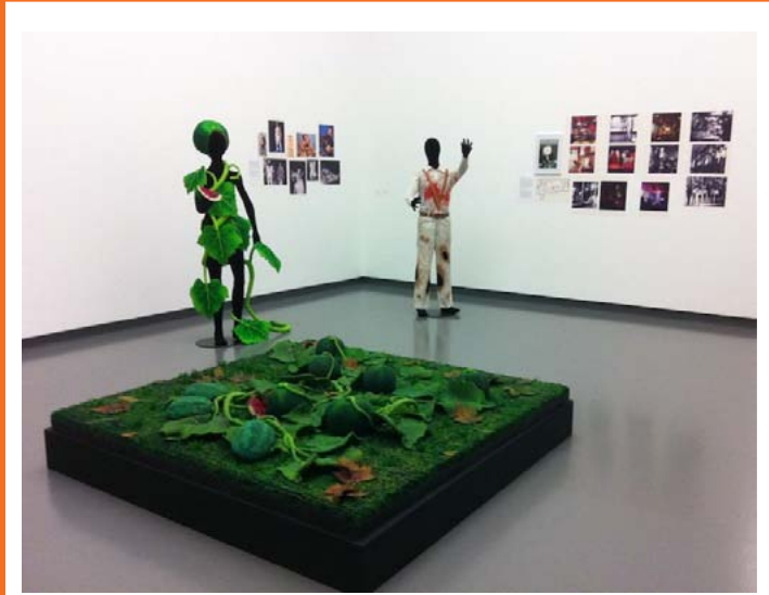
Angurie , Piero Gilardi, 1967 Tapis synthétique imitant une cucurbitacée