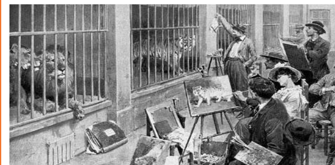
Peintres animaliers, Jardin des Plantes (1902)