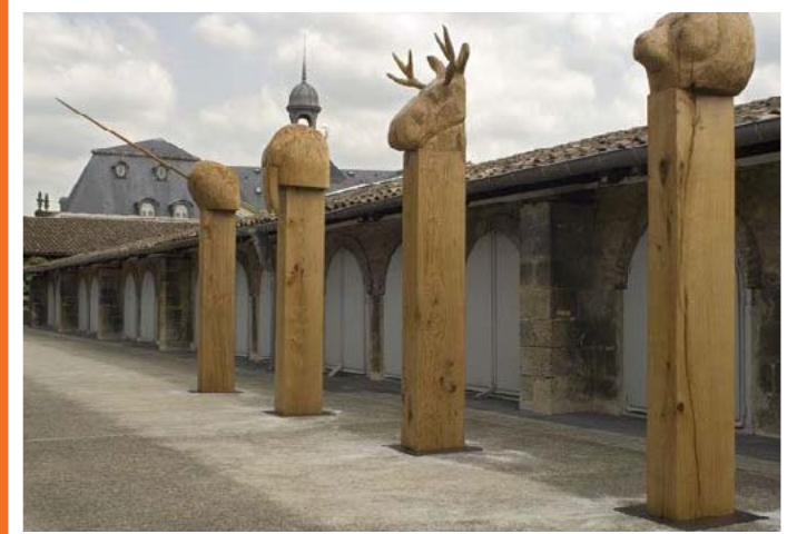
Totems , 2007, chêne Environ 2m60x50x50cm chacun

Ses dessins quant à eux ont un rapport organique avec la nature. Réalisés en noir et blanc, au crayon sur papier, on y découvre des humains qui se fondent dans la forêt, des animaux qui copulent, des fragments de territoire qui laissent beaucoup de place à l'imagination.