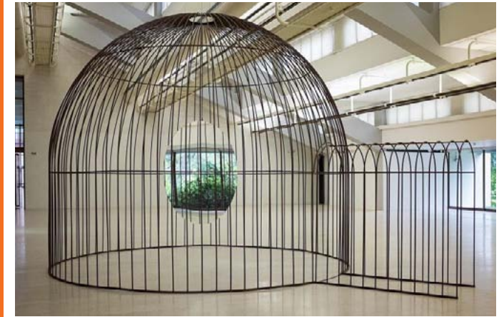
Cage and Mirror , Jeppe Hein, 2011 Installation: miroir tournant, cage métallique.