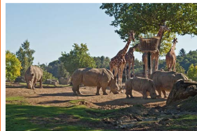
Zooparc de Beauval, 2012