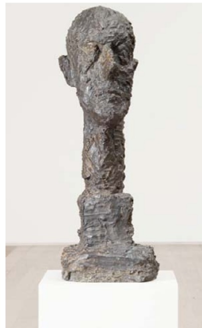
Giacometti Grande-tete , 1960