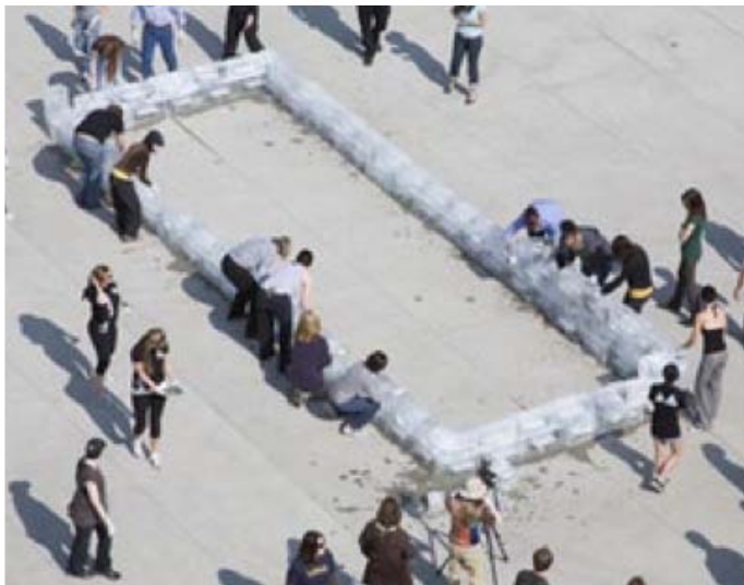
Allan Kaprow fluids 1967-2012