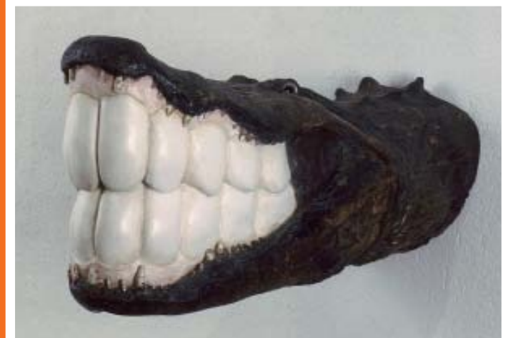
Sirène et sourire 1994-1996