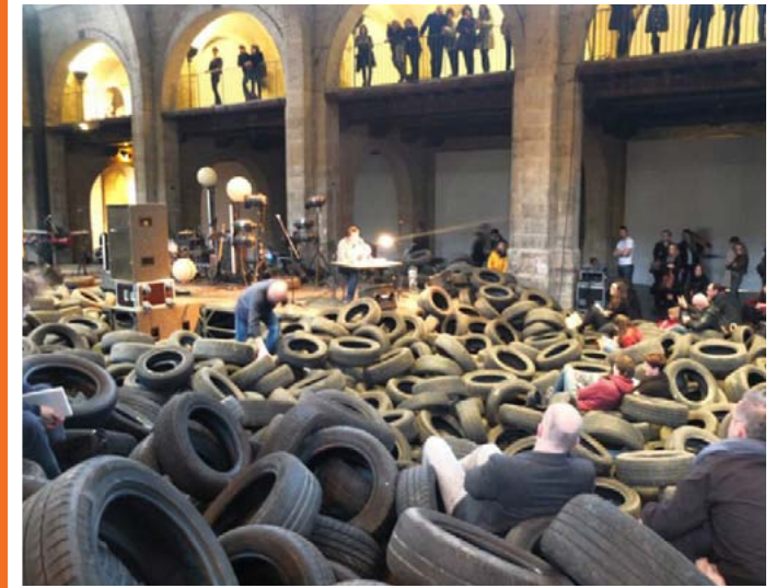
Allan Kaprow, Yard, 1961-2014. CAPC Bordeaux

Allan Kaprow, qui nous a fait découvrir la notion d'interaction comme œuvre. J'aime son approche de l'art comme un jeu sérieux, qui croise les imaginaires quelles que soient les situations sociales. C'est une manière de faire (et de partager) l'expérience de notre environnement, avec ses tensions formelles et sa fragilité.