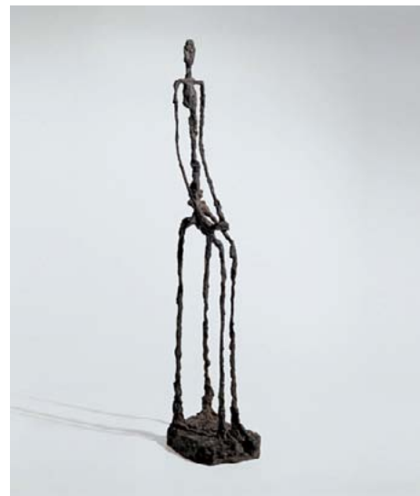
Giacometti, Femme-assise , 1946

Giacometti, parce que j'ai eu le plaisir de mouler certaines de ses sculptures dans ma jeunesse, et que chacune est à la fois directe et complexe. Sa traduction de l'instabilité du regard avec des matières et des formes, reste pour moi un vrai mystère.