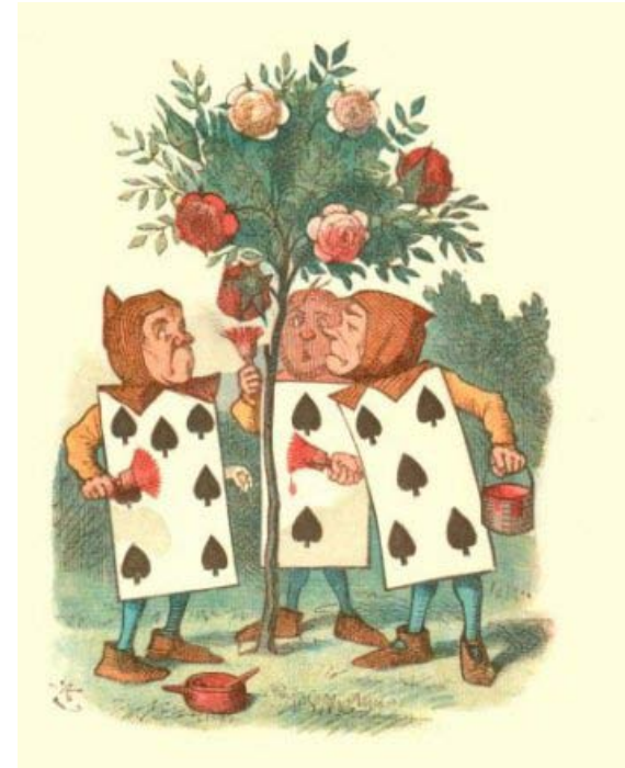
Alice aux Pays des merveilles, Lewis Carroll, Les valets de la reine chargés de peindre les arbres