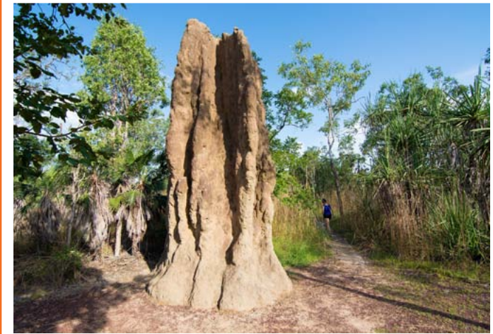
Termitières, Afrique du sud