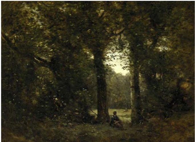
La clairière, Souvenir de la ville d'Avray, Jean Baptiste Camille Corot, entre 1869 et 1872