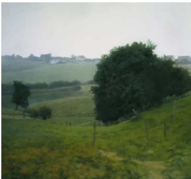
Wiesental, Gerhart Richter, MOMA New York U.S.A, Oil on canvas, 1985