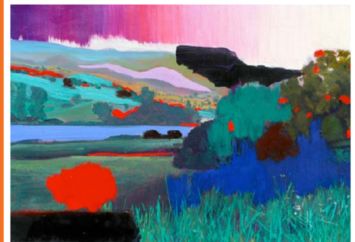
Retouches, Filitosa , 2008