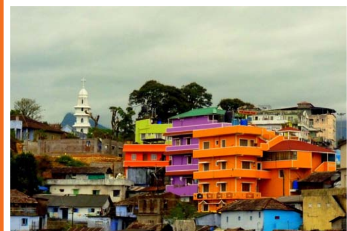
Maisons colorées en Inde du sud