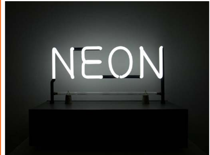
Néon, Joseph Kosuth, 1965