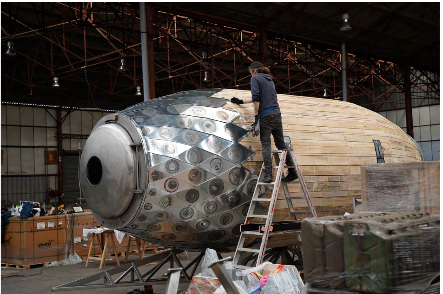
Image de production - Aux ocelles, Antoine Dorotte (2024).