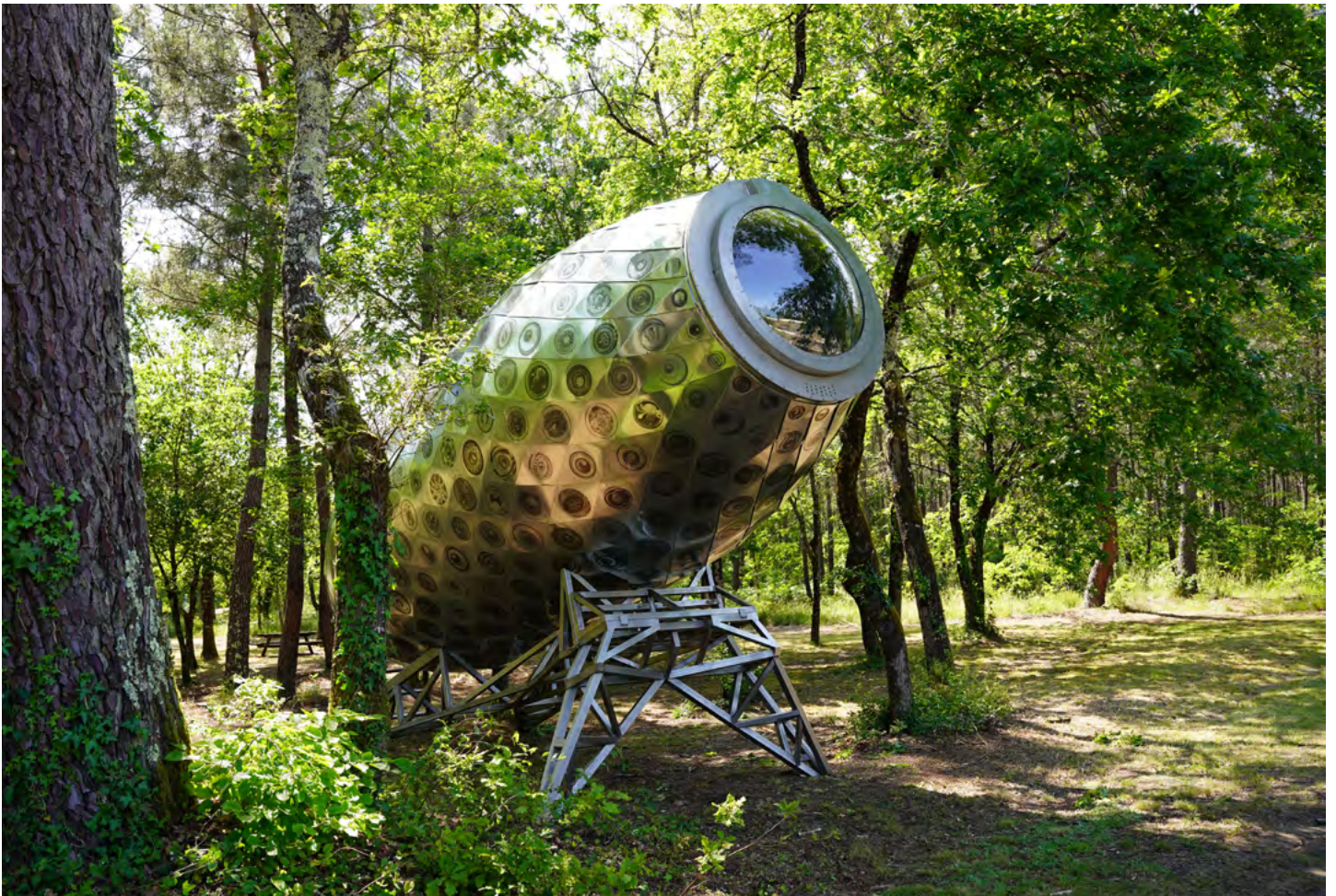
Aux ocelles, Antoine Dorotte (2024).