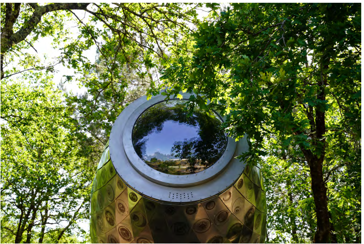
Aux ocelles, Antoine Dorotte (2024). Photo : Barbara Fecchio © ADAGP, 2024