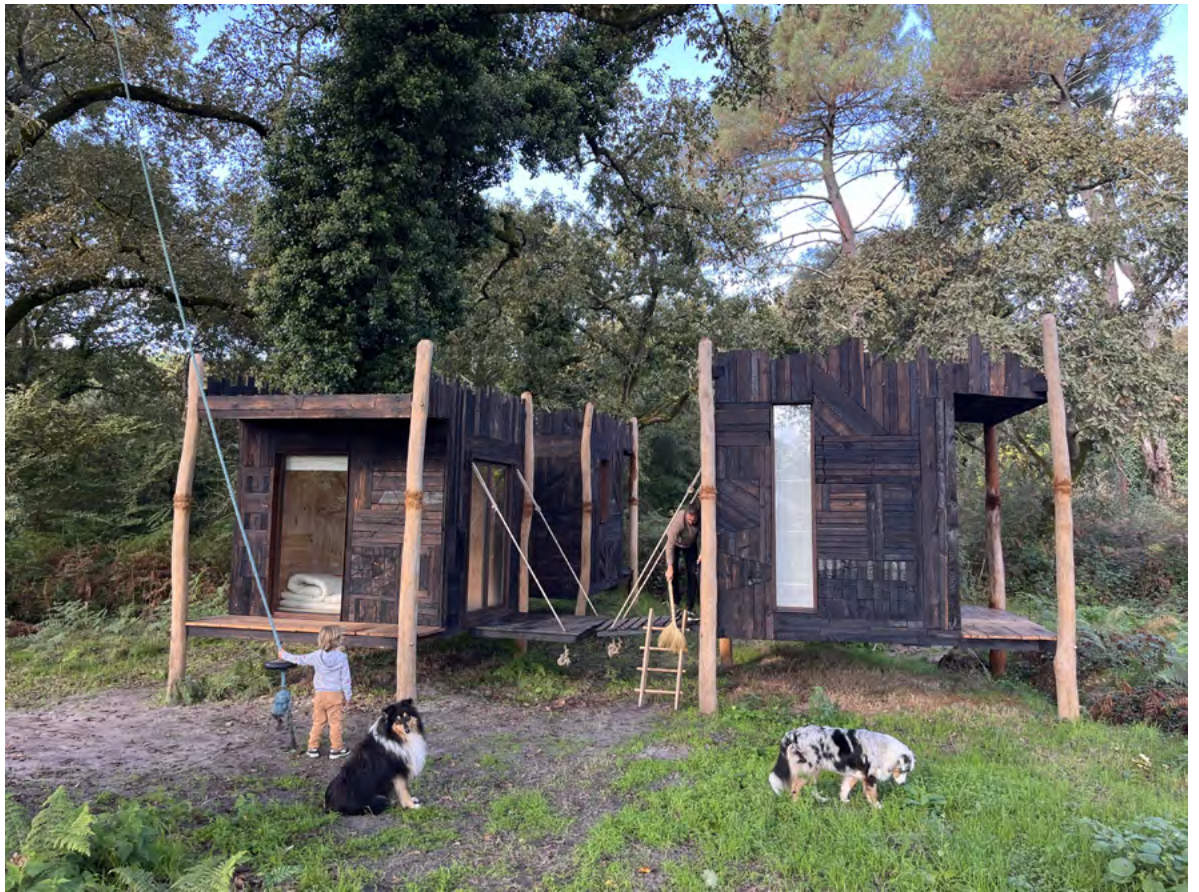
De l'aptitude à cueillir un pissenlit fermenté , Sara Favriau (2024).