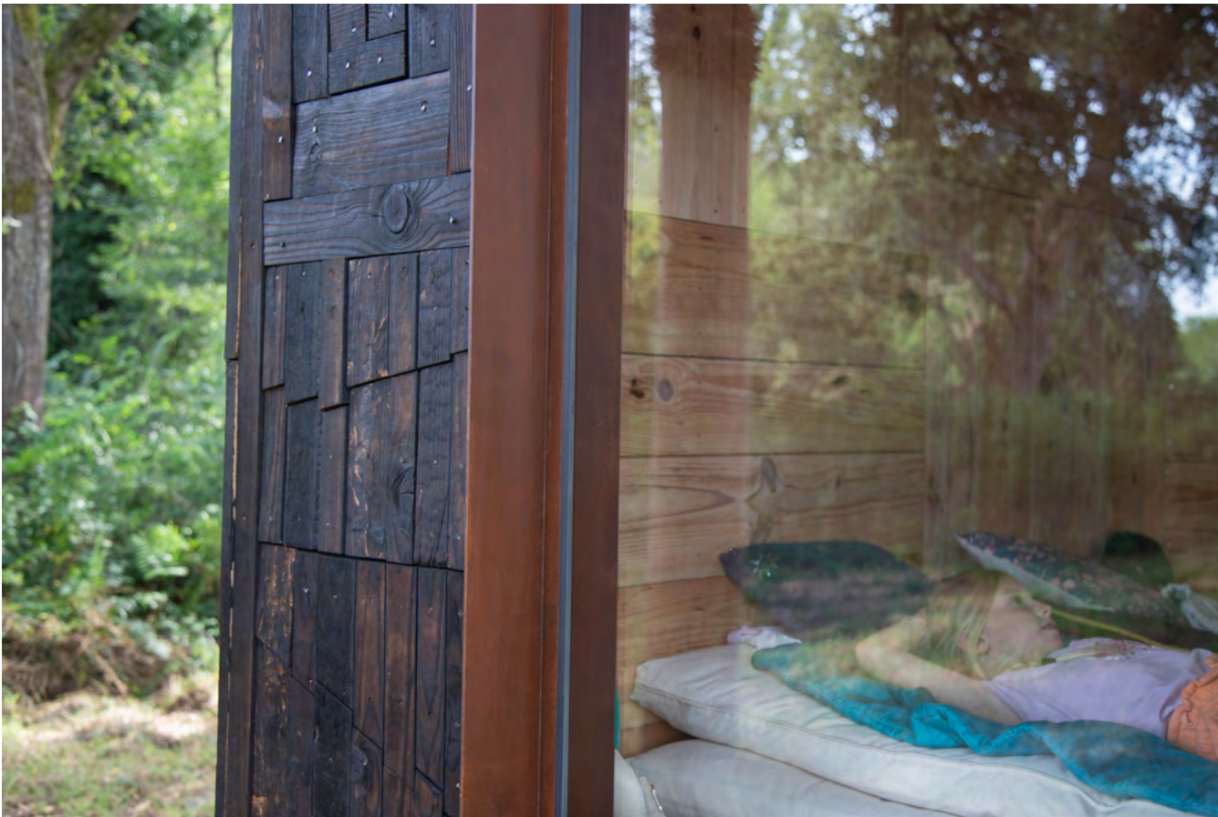
De l'aptitude à cueillir un pissenlit fermement , Sara Favriau (2024).