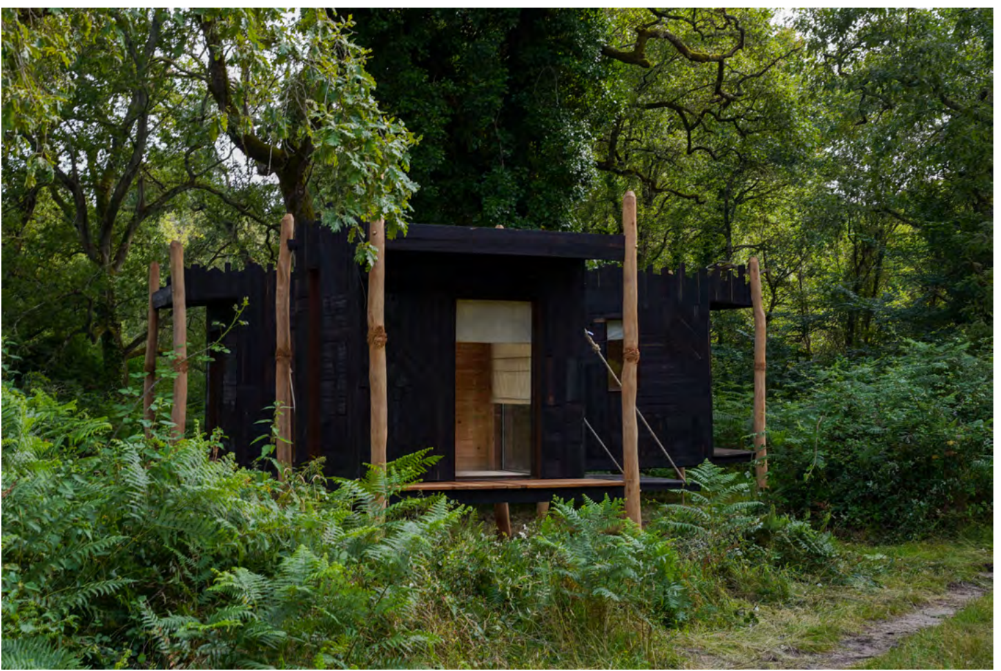
De l'aptitude à cueillir un pissenlit fermement , Sara Favriau (2024).