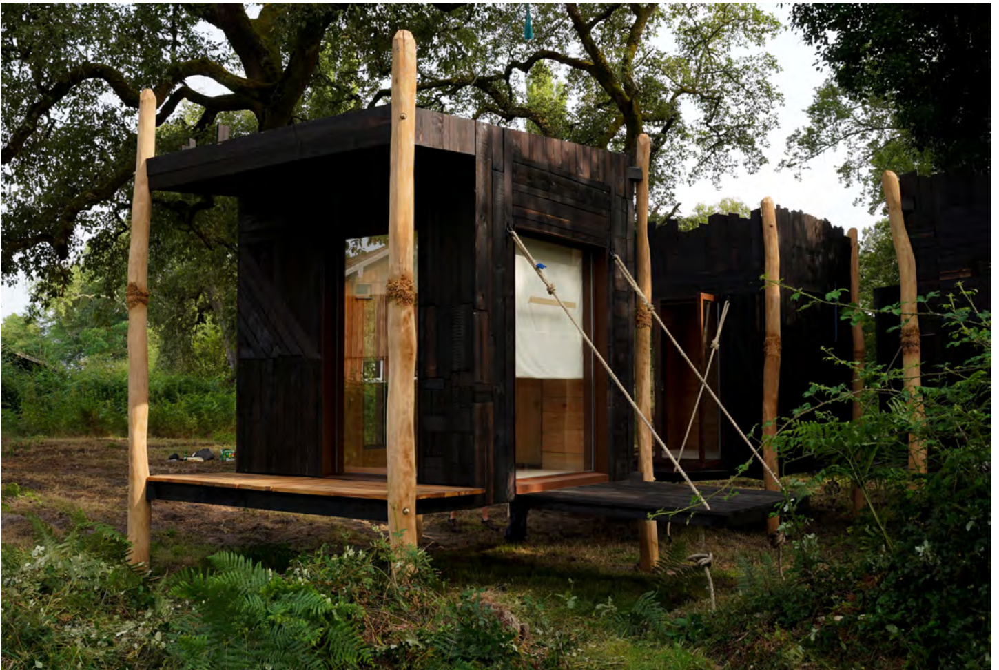
De l'aptitude à cueillir un pissenlit fermement , Sara Favriau (2024). © ADAGP, 2024