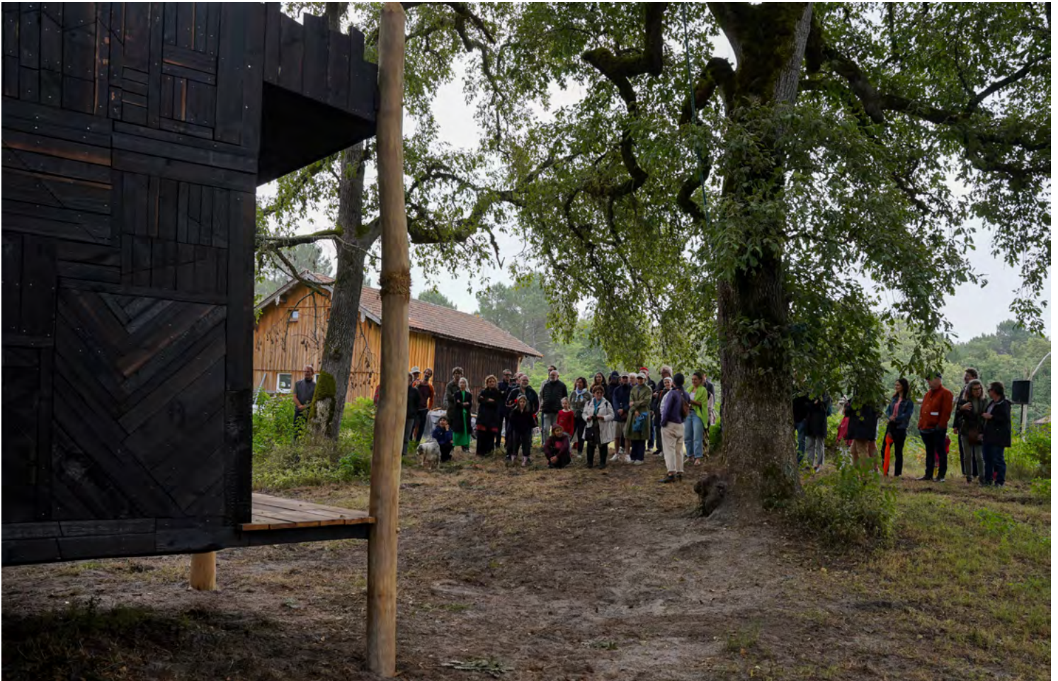
De l'aptitude à cueillir un pissenlit fermement, Sara Favriau (2024).