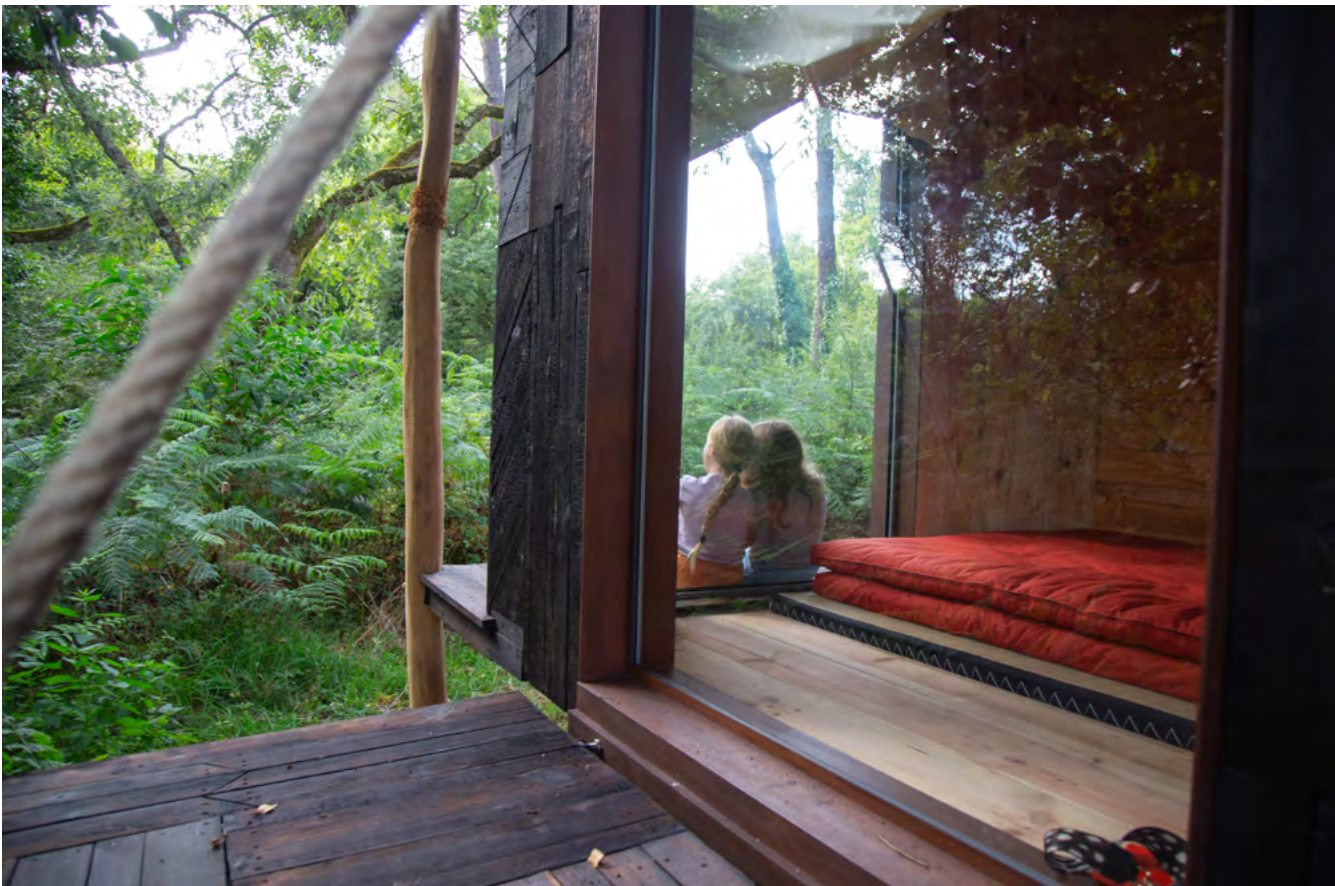
De l'aptitude à cueillir un pissenlit fermement , Sara Favriau (2024). Photo : Lydie Palaric © ADAGP, 2024